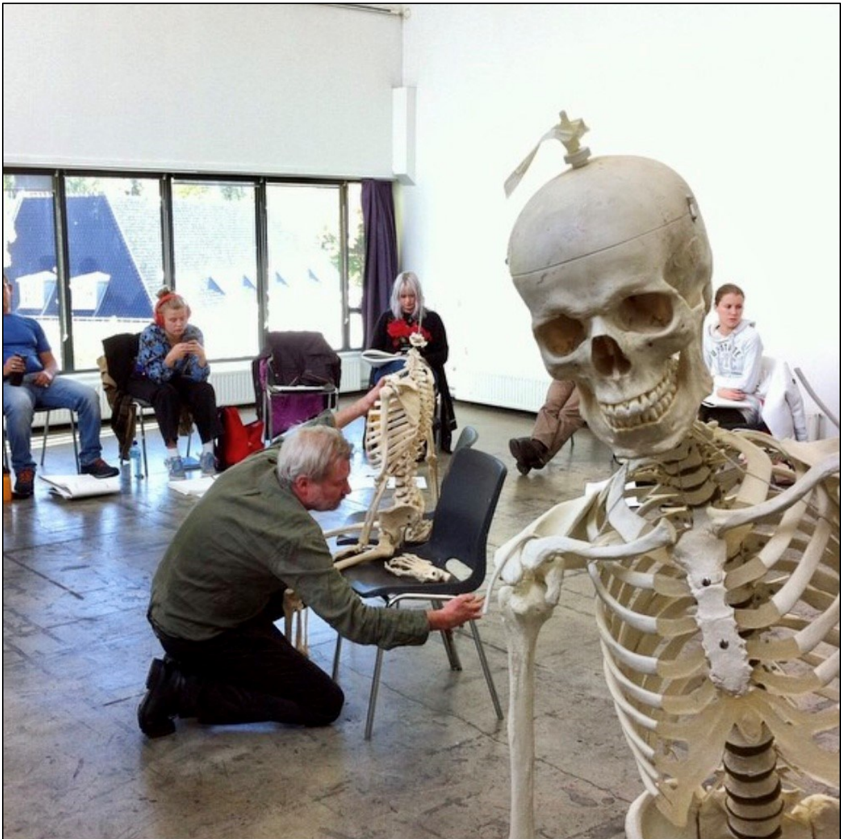
Fra «Akt (skjelett)» høsten 2018.

Undervisningen er delt opp i emner, der alle emnene må være bestått for at vitnemål skal kunne utstedes etter to år. I de tilfeller der studenten ikke har bestått alle emner tildeles kompetansebevis.